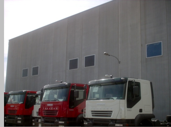
IMÁGENES EXTERIORES DE LA NAVE