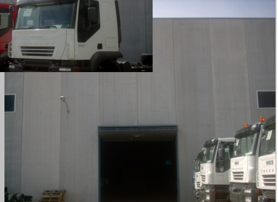
PLANTA GENERAL DE LA NAVE